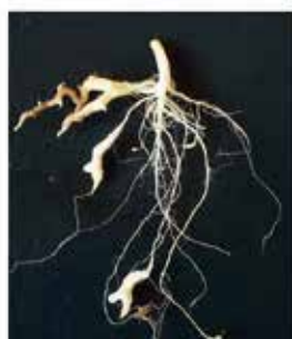
1 = schwacher Befall mit vereinzelten kleinen Gallen