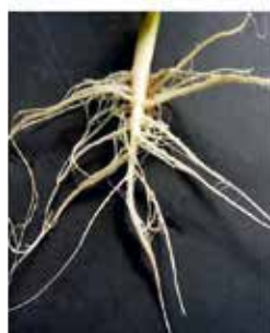
0 = kein Befall