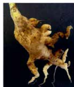
3 = starker Befall

Boniturnoten 0-3 anhand von Beispielbildern