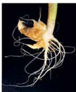
2 = kleine Gallen an den Neben- und Hauptwurzeln