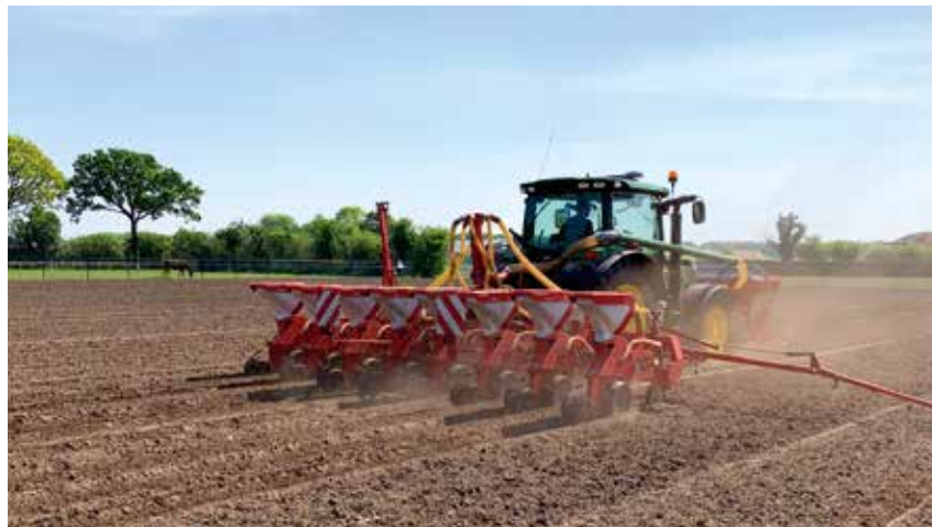
Um die Altverunkrautung sicher zu entfernen, sollte die Aussaat vorrangig in einen frisch gepflügten Acker erfolgen.

Da Sorghum eine wärmeliebende Kultur ist, sollte die Aussaat erst ab Anfang Mai bei 12 bis 14 °C Bodentemperatur erfolgen. Gute Aussaatbedingungen sind Voraussetzung für eine zügige Jugendentwicklung. Um die Altverunkrautung sicher zu entfernen, sollte die Aussaat vorrangig in einen frisch gepflügten Acker erfolgen. Sie kann als Drill- oder als Einzelkornsaat (Maislegegerät) erfolgen, wobei passende Säscheiben zu verwenden sind. Wegen der besseren Rückverfestigung, ins-