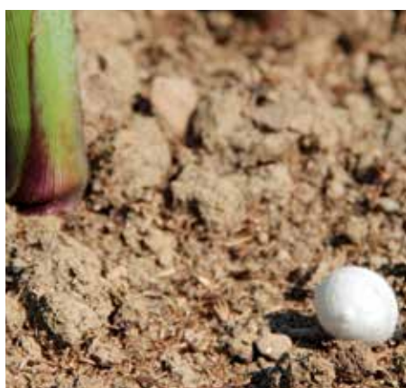
Die Trichogrammalarven leben in unterschiedlichen Schlupfstadien in den Kapseln.