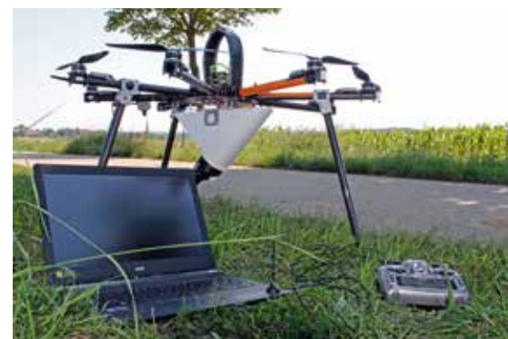
Laptop und Steuerungsmodul reichen, um den Copter zu fliegen.

Die beladene Drohne darf maximal fünf Kilogramm wiegen. Das reicht für etwa sieben Hektar oder 20 Minuten Flugzeit. Je nach Bauweise düst ein Copter mit einer Flughöhe von 15 bis 25